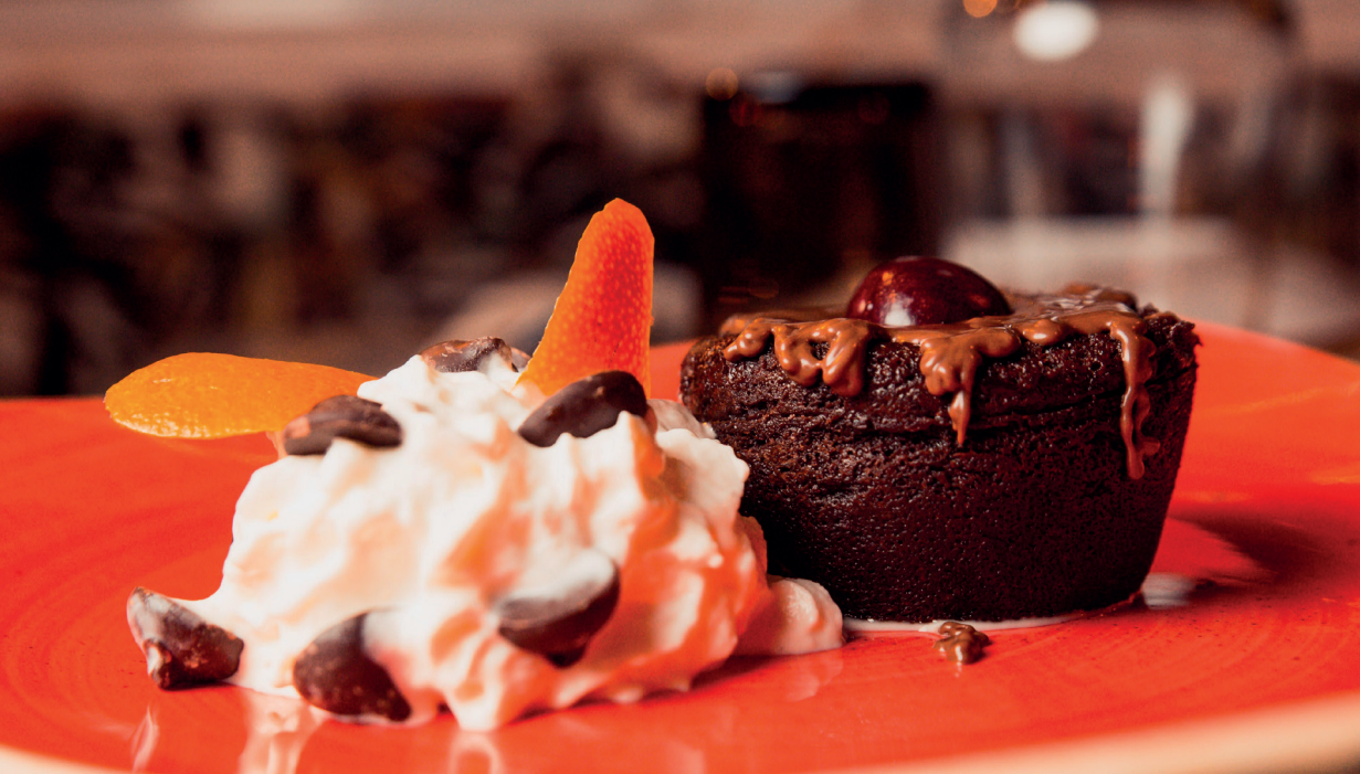
Coulant de chocolate