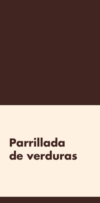
Parrillada de verduras