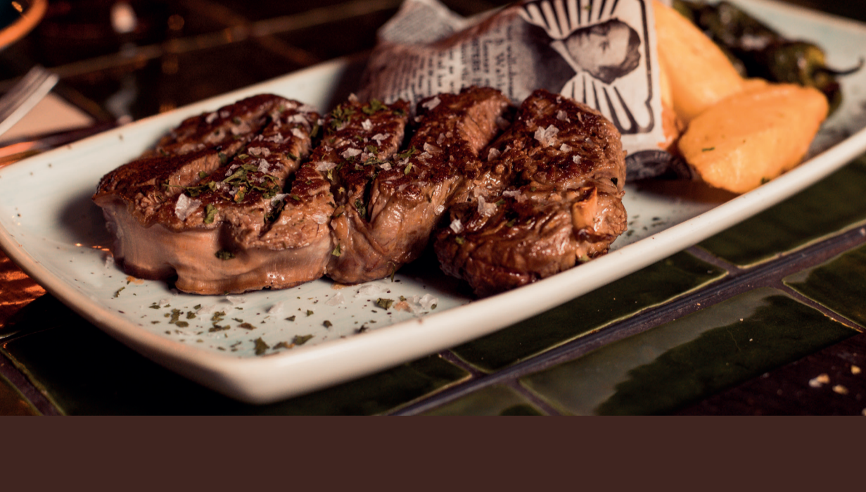
Solomillo de buey